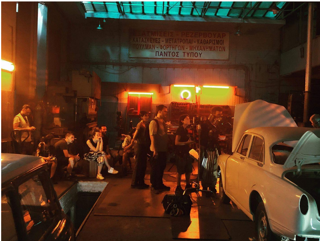
Ο μηχανικός (2019) σκην. Δημήτρης Κοτσέλης

Δεν έχω καταλάβει ότι η εν λόγω συζήτηση έχει ανοίξει στην Ελλάδα σε μια διευρυμένη κλίμακα. Ναι θα ήταν κάτι που θα ήθελα, αν και με λυπεί ιδιαίτερα που το 2020 πρέπει ακόμα να εφαρμόζονται ποικίλα μετρά για την διασφάλιση του αυτονόητου.