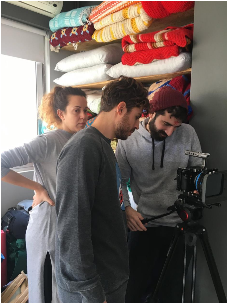
ΣΕΔΙΚΕ σκην. KIMINO

"Έχω αρκετές ιστορίες να διηγηθώ αλλά νομίζω θα αναφερθώ στη συχνότητα που λαμβάνω τηλεφωνήματα από παραγωγούς για δουλειά με το opening line πως ο άνδρας συνάδελφος που ήταν η πρώτη τους επιλογή δεν προλαβαίνει να αναλάβει το project. "